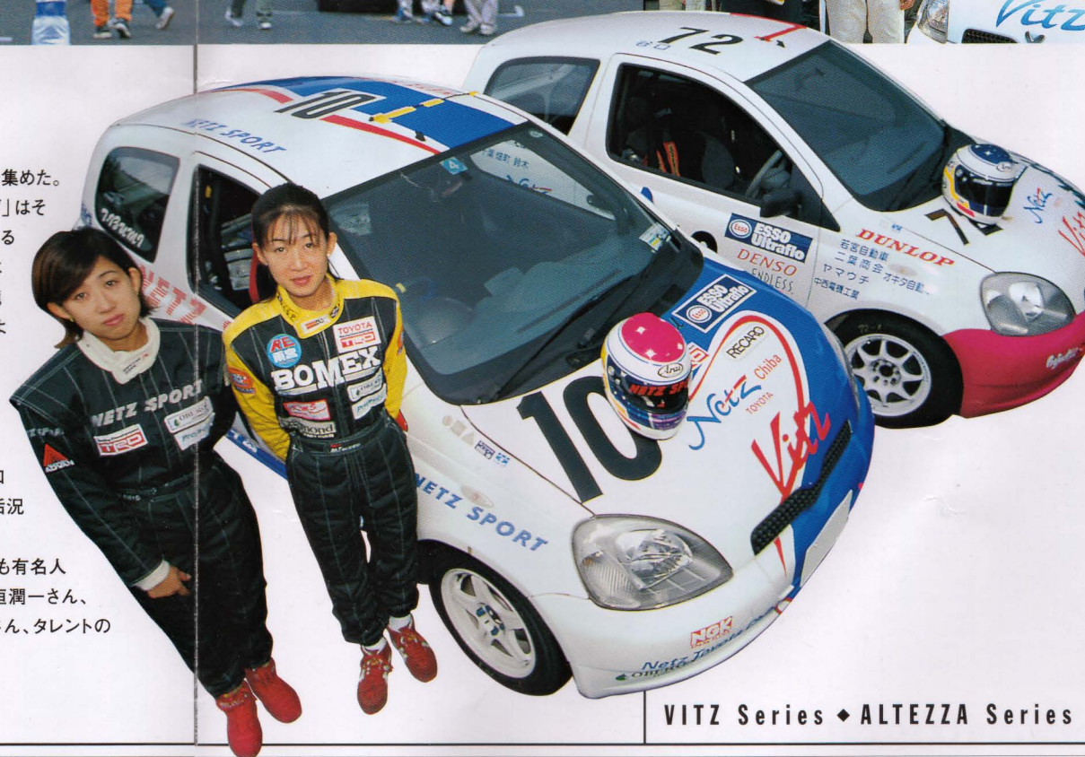
VITZ Series ◆ ALTEZZA Series

などの有名人も参戦し、注目を集めた。一方の「アルテッツァシリーズ」はその名の通りアルテッツァによるワンメイクレースだが、こちらはヴィッツシリーズとは異なり、純然としたレーシングマシンによる本格的なツーリングカーレースだ。プロを目指すドライバーたちの戦場であるだけに、こちらは初年度からハイレベルなバトルを展開。参加台数も毎回40台近くを集め活況を呈した。また、アルテッツァシリーズにも有名人が参加、ミュージシャンの稲垣潤一さん、TUBEのドラマー松本玲二さん、タレントのヒロミさんらが挑戦した。